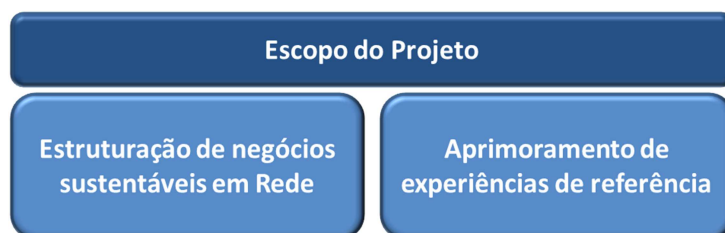
Figura 2: Formas de atuação do CATAFORTE - Negócios Sustentáveis em Redes Solidárias

Serão desenvolvidas ações que envolverão assistência técnica, formação e capacitação e infraestrutura para as redes de empreendimentos solidários. Poderá haver duas formas de atuação do projeto, sendo a primeira, de caráter estruturador de negócios sustentáveis e para a qual haverá maior aporte de recursos. A segunda terá a finalidade de estimular a consolidação de experiências que possam ser adotadas como modelos de atuação de redes na cadeia produtiva de resíduos sólidos, a fim de que possam ser replicadas.